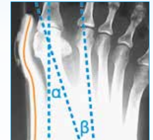
Korrektur mit angelegter HALLUFIX®-Schiene

\alpha = Hallux Valgus-Winkel, \beta = Intermetatarsal-Winkel