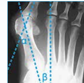
Hallux Valgus ohne Schiene

HALLUFIX® kann das Fortschreiten des Hallux Valgus stoppen. Die international patentierte Hallux Valgus Schiene wurde in Zusammenarbeit mit der Fraunhofer Gesellschaft und Orthopäden entwickelt, um die Fehlstellung des Ballenzehs wirksam zu korrigieren und Schmerzen gezielt zu lindern.